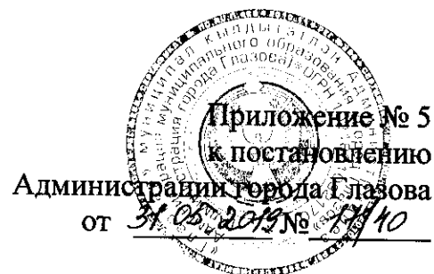
ГРАФИК заседаний комиссии по обеспечению своевременной подготовки и устойчивого проведения отопительного периода 2019 – 2020 годов в муниципальном образовании «Город Глазов»