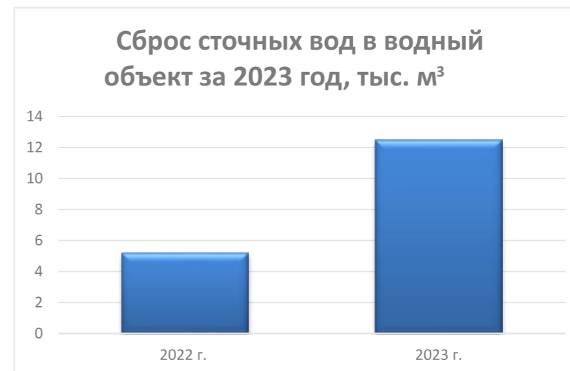
Рисунок 1. Динамика объемов сброса сточных вод в водный объект

Как уже было сказано, АО «РИР» является правопреемником ООО «Тепловодоканал» со всеми правами и обязанностями. Ранее принадлежавшее имущество ООО «Тепловодоканал» в результате присоединения перешло на баланс АО «РИР», в связи с чем произошел рост сбросов.